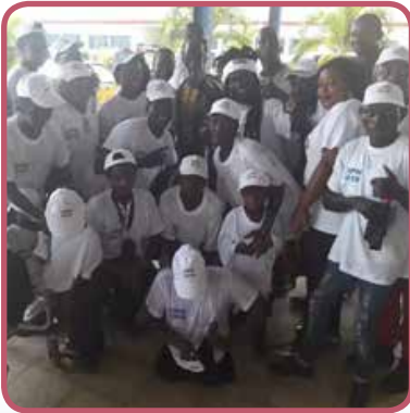
3 december, internationale dag voor gehandicapten.

Leuk voor iedereen, maar onze reactie is dan: Waarom krijgt Centre Nimba nog steeds geen geld van de overheid van Guinee?